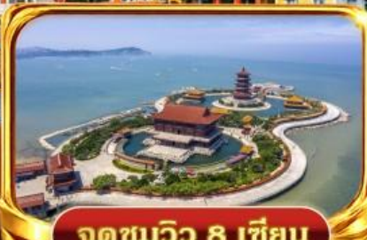
จุดชมวิว 8 เซียน