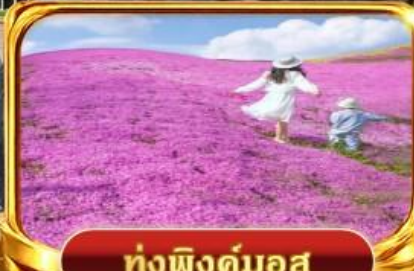
ทุ่งฟิงคิมอส