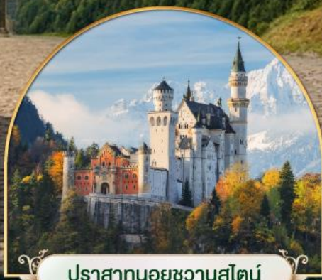
ปราสาทนอยชวานสไตน์ เยอรมนี