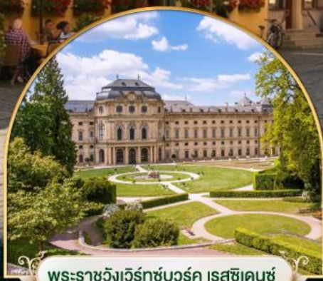
พระราชวังแวร์ซายส์ ฝรั่งเศส