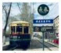
มังกรธาฉางชุน