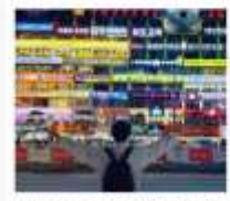
กำแพงมหาวิทยาลัยเหอชี่หมเป็น