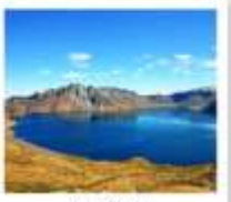
ฉางไป่ซาน