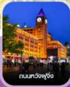
ถนนทวิงฟู่จิ่ง