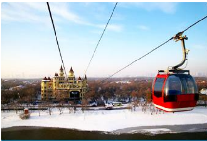
นั่งกระเช้าชมแม่น้ำชววาเจียง