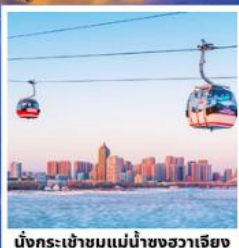
นั่งกระเช้าชมแม่น้ำของฮาร์เบีย