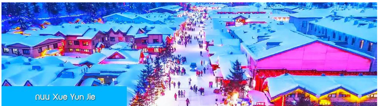
ถนน Xue Yun Jie