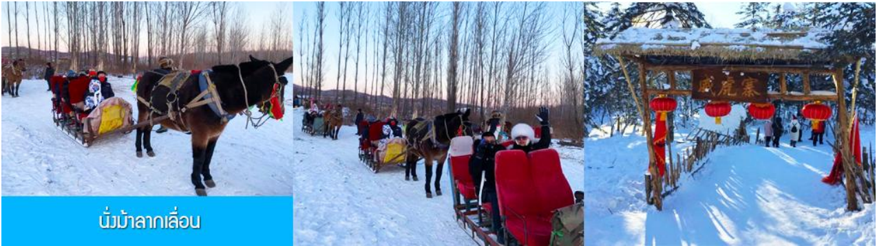
นั่งม้าลากเลื่อน

นำท่านสัมผัสประสบการณ์ นั่งม้าลากเลื่อน ผ่านลานหิมะและแนวป่า 馬拉雪橇 (รวมในค่าทัวร์แล้ว)