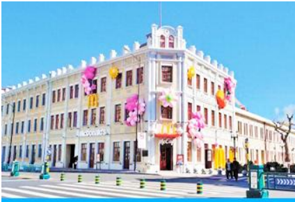
ถนนซันบารอค