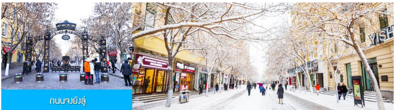
ถนนจงย่งถู

หลังอาหารเช้าท่านชม อนุสาวรีย์ฝงหวง 防洪纪念碑 อนุสรณ์ของชาวเมืองฮาร์บินที่ถูกจารึกในประวัติศาสตร์ ในการเอาชนะอุทกภัยธรรมชาติครั้งใหญ่ในปี ค.ศ. 1957