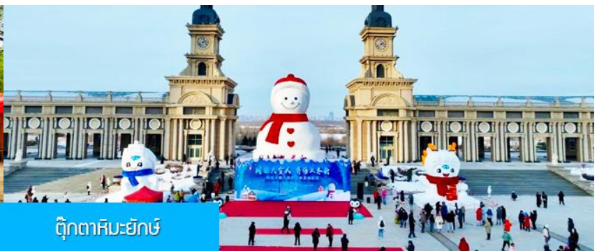
ตุ๊กตาหิมะยักษ์

เที่ยง รับประทานอาหารกลางวัน ณ ภัตตาคาร (8)