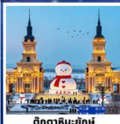
ตุ๊กตาหิมะยักษ์