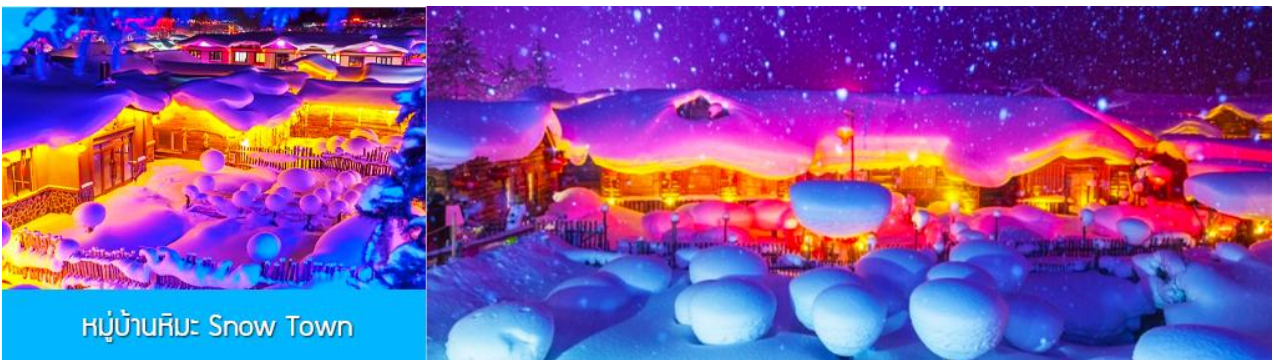
หมู่บ้านหิมะ Snow Town

ท่ามกลางท้องทุ่งและผืนป่าที่ปกคลุมด้วยหิมะราวกับอยู่ในโลกแห่งเทพนิยาย ผ่านหมู่บ้าน เวहु่จ้าย 威虎寨 ที่อดีตเคยเป็นที่ตั้งของรังโจรที่มักออกปล้นสะดมชาวบ้าน ม้าลากเลื่อนเป็นยานพาหนะเฉพาะพื้นที่ ๆ ที่นิยมนำมาใช้ในการเดินทางหรือลำเลียงสิ่งของในช่วงฤดูหนาว ที่ใช้ม้าลากจูงแคร่เลื่อนให้สามารถเคลื่อนย้ายบนลานหิมะได้