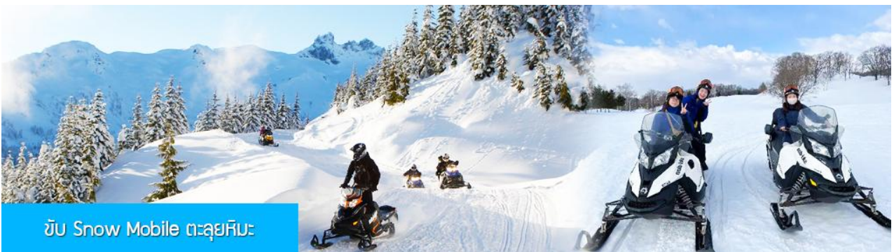
ขับ Snow Mobile ตะลุยหิมะ

ไกด์ท้องถิ่นนำเสนอโปรแกรมเสริม หรือ OPTIONAL TOUR ให้ท่านเลือกตามความสมัครใจ