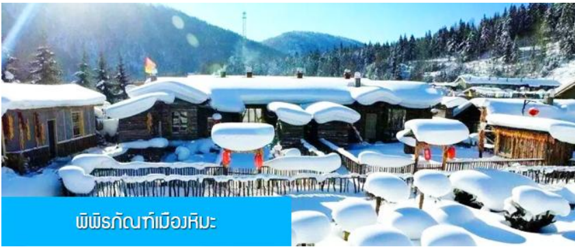
พิพิธภัณฑ์เมืองหิมะ

การไปพักในหมู่บ้านหิมะทางทัวร์ไม่สามารถจัดรถทัวร์ไปส่งลูกค้าถึงหน้าโฮมสเตย์ได้ igit จะนำคณะขึ้นรถ Shuttle Bus ของอุทยานเข้าไปยังหมู่บ้านหิมะ โดยลูกค้าต้องถือหรือลากกระเป๋าเข้าที่พักด้วยตัวเอง เพราะโฮมสเตย์จะไม่มีพนักงานยกกระเป๋า มาคอยบริการยกกระเป๋าให้ผู้เข้าพัก ท่านควรจัดเตรียมกระเป๋าใบเล็กที่บรรจุเสื้อผ้า และเครื่องใช้จำเป็นสำหรับการพักผ่อน ณ โฮมสเตย์ในเมืองหิมะในคืนนี้ เพื่อสะดวกต่อการเคลื่อนย้ายกระเป๋า ภายในโฮมสเตย์จะมีสบู่เหลว แชมพูภายในห้องน้ำ ท่านควรเตรียมหมวกคลุมผมอาบน้ำไปด้วย