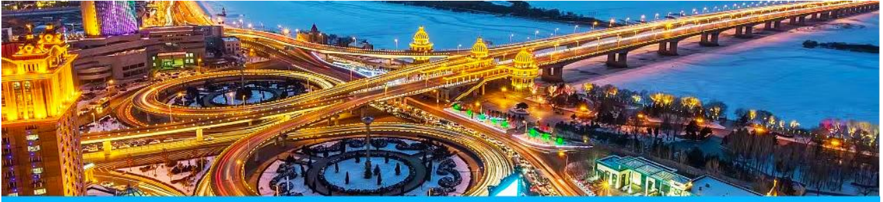
นครฮาร์บิน