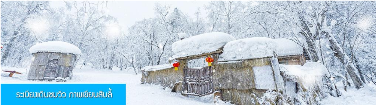
ระเบียบเดินชมวิว ภาพเขียนสลับ

นำท่าน เที่ยวชมระเบียบชมวิวภาพเขียนสลับ 冰雪十里画廊 (รวมค่าบัตรเข้าชมแล้ว) เป็นการเดินชมวิวธรรมชาติตามเนินเขา ท่ามกลางแนวป่าที่มีต้นไม้ที่มีน้ำแข็งเกาะอยู่ตามกิ่งไม้ ภูเขาทั้งลูกถูกห่อหุ้มด้วยหิมะขาวฟู เป็นภาพวิจิตรธรรมชาติดูหนาวที่สวยงามน่าประทับใจและพบได้เฉพาะในฤดูหนาวทางภาคอีสานของจีนเท่านั้น เวลาที่ใช้สำหรับโปรแกรมเสริมนี้ประมาณ 1 ชั่วโมงครึ่ง