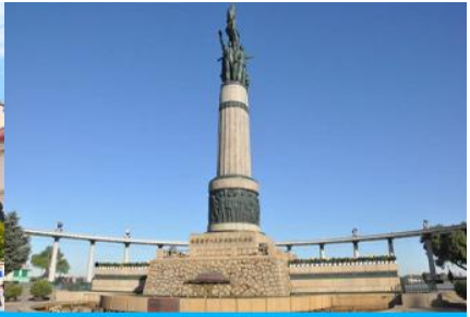
อนุสาวรีย์ฟิวหวง

วันที่ห้า เมืองฮาร์บิน – ถนนซัน-บารอค-โบสถ์โซเฟีย-อนุสาวรีย์ป้องกันอุทกภัย-อิสระช้อปปิ้งย่านถนนจงยาง-สนามบินฮาร์บิน