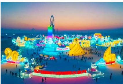
เทศกาลแกะสลักน้ำแข็งนานาชาติ

นำท่านชมและถ่ายภาพกับ รูปปั้นตุ๊กตาหิมะยักษ์ 网红大雪人 เป็นตุ๊กตาหิมะขนาดใหญ่ความสูง 18 เมตร ที่ทางเทศบาลเมืองฮาร์บินจัดทำขึ้นในช่วงฤดูหนาวของทุกปี เช่นเดียวกับการประดับต้นคริสมาสต์ในช่วงเทศกาลของชาวตะวันตก จนกลายเป็นสัญลักษณ์แห่งฤดูหนาวของเมืองฮาร์บิน