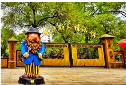
หมู่บ้านรัสเซีย

หลังอาหารนำท่านเดินทางโดยรถบัสสู่ เมืองฮาร์บิน (ระยะทาง 138 กม.ใช้เวลาเดินทางราว 2 ชั่วโมง) นำท่าน นั่งกระเช้าชมความสวยงามของแม่น้ำชววาเจียงในฤดูหนาว 乘缆车跨越松花江 แม่น้ำสายหลักที่ไหลผ่านเมืองฮาร์บิน ในช่วงฤดูหนาวน้ำในแม่น้ำชววาจะกลายเป็นลานน้ำแข็งขนาดใหญ่และปกคลุมด้วยหิมะ ชม หมู่บ้านรัสเซีย 俄罗斯小镇 ชมบ้านเรือนและรีสอร์ทสไตล์รัสเซียรวม 27 หลังภายในหมู่บ้านเล็ก ๆ แห่งนี้ ตั้งอยู่บนเกาะพระอาทิตย์ 位于太阳岛上 เมื่อนักท่องเที่ยวมาเยือนในหมู่บ้านเสมือนท่านกำลังเดินเล่นอยู่ในหมู่บ้านหนึ่งใน รัสเซีย