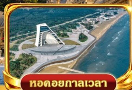
หอดอยกาลเวลา