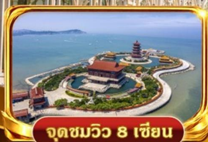
จุดชมวิว 8 เซียน