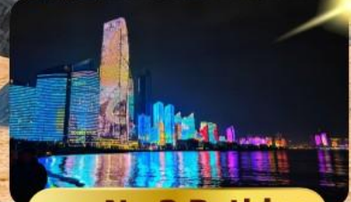
หาด No.3 Bathing

เมนูพิเศษ ซาบูสายพาน 6 วัน 4 คืน เดินทาง : พฤษภาคม 69