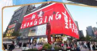
ถนนคนเดินถวณอันเฉียว