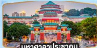
มหาศาลาประชาชน