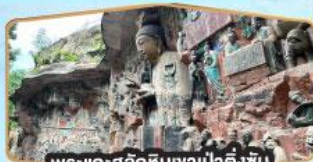
พระแกะสลักหินงาป่าติ่งซัน