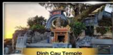
Dinh Cau Temple