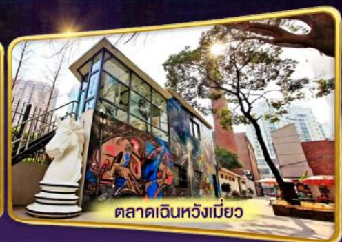
ตลาดเดินห้างเมียว