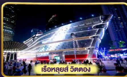
เรือหลุยส์ วิตตอง