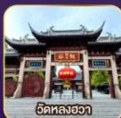
วัดหลงอา