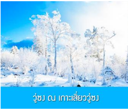
วู่ซง 凇 เกาะสิ่ววู่ซง

พักที่ JILIN LUNWEIKE HOTEL โรงแรมระดับ 4 ดาวท้องถิ่นหรือเทียบเท่า ในเมืองจีหลิน