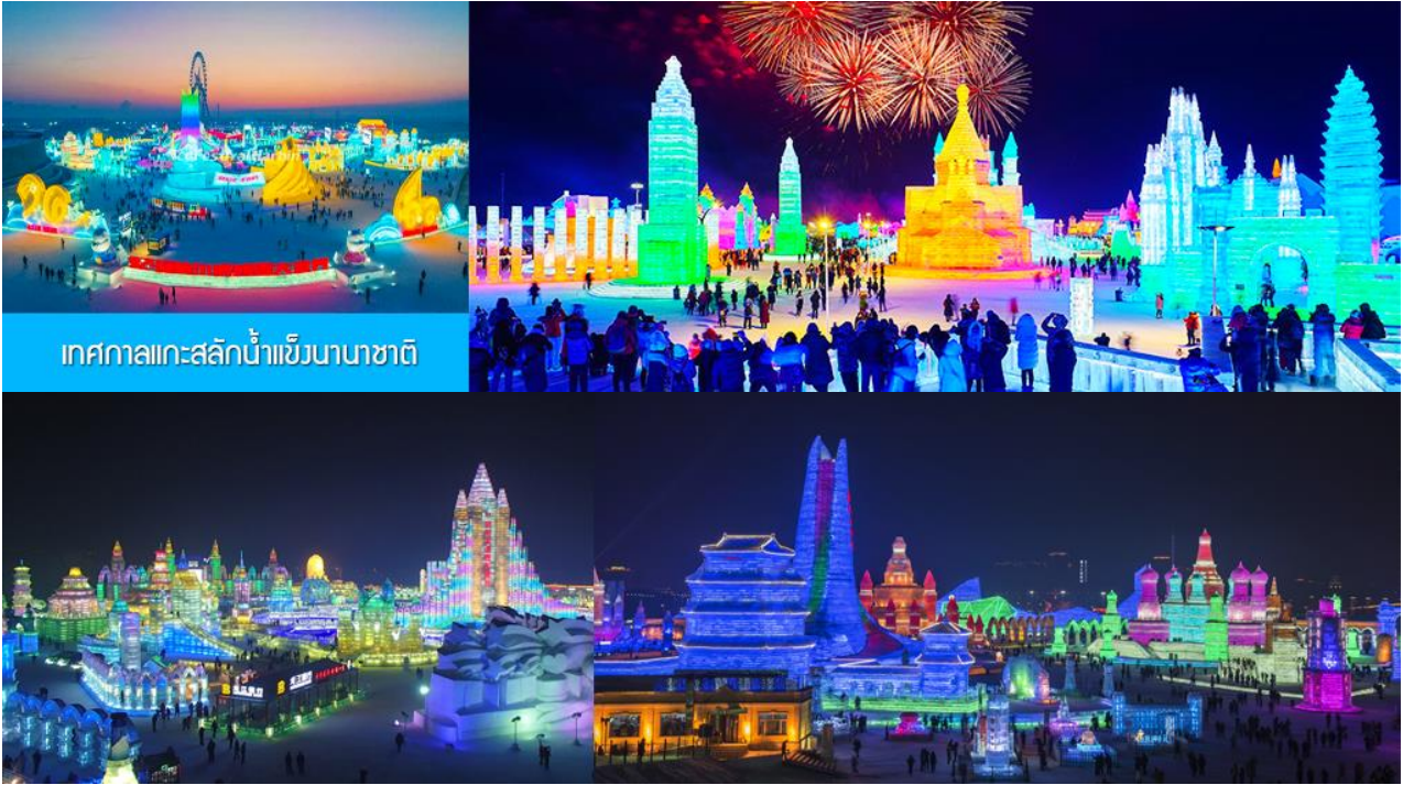
เทศกาลแกะสลักน้ำแข็งนานาชาติ

รับประทานอาหารค่ำ ณ ภัตตาคาร *สุกี้* (14)