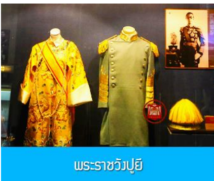
พระราชวังปูยี

หลังอาหารนำท่านเช็คเอาท์ออกจากโรงแรมที่พักแล้วเดินทางสู่ เมืองฉางชุน 长春市 (ระยะทาง 120 กม.ใช้เวลาเดินทางราว 1 ชั่วโมงครึ่ง)