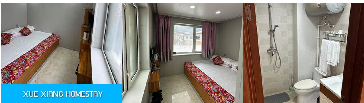
XUE XIANG HOMESTAY