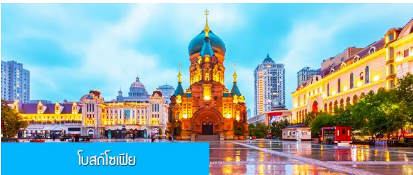
โบสถ์โซเฟีย