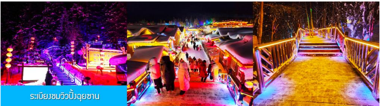
ระเบียบชมวิวยังอุทยาน

เมื่อเดินทางถึงหมู่บ้านหิมะ นำท่านเปลี่ยนมาใช้รถบัสของอุทยานเดินทางเข้าหมู่บ้าน เนื่องจากรถบัสที่อาจจะไม่สามารถเข้าไปในหมู่บ้านได้ นำท่านเช็คอินเข้าที่พักเรียบร้อยแล้ว