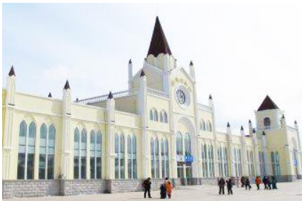
สถานีรถไฟยาบูลี

หมายเหตุ เพื่อความสะดวกในการเข้าพักใน HOME STAY ภายในหมู่บ้านหิมะ ทางทัวร์แนะนำให้ท่านจัดเตรียมเสื้อผ้าและเครื่องใช้เท่าที่จำเป็น 1 ชุดใส่กระเป๋าใบเล็กหรือเป้แบบสะพายได้ เพื่อสะดวกในการนำติดตัวไปใช้สำหรับคืนที่นอนในหมู่บ้านหิมะ หากนำกระเป๋าเดินทางใบใหญ่เข้าสู่ที่พักในหมู่บ้านอาจสร้างความไม่สะดวกแก่ท่าน จึงไม่แนะนำ