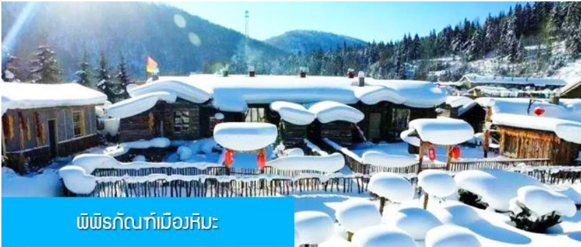
พิพิธภัณฑ์เมืองหิมะ

และเครื่องใช้จำเป็นสำหรับการพักผ่อน ณ โฮมสเตย์ในเมืองหิมะในคืนนี้ เพื่อสะดวกต่อการเคลื่อนย้ายกระเป๋า ภายในโฮมสเตย์จะมีสบู่น้ำหอม แชมพูภายในห้องน้ำ แปรงสีฟันยาสีฟัน แต่จะไม่มีหมวกคลุมผมสำหรับสภาพสตรี ควรเตรียมไปด้วย