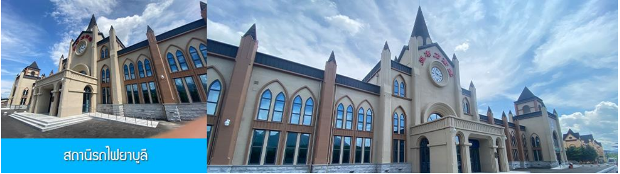
สถานีรถไฟยบูลี

นำท่านเที่ยวชม สถานีรถไฟยบูลี 亚布力南站 (ชมด้านนอก) ได้ชื่อว่าเป็นสถานีรถไฟที่สวยงามที่สุดของจีน โดดเด่นด้วยสถาปัตยกรรมแบบตะวันตก ให้ท่านเก็บภาพบรรยากาศความสวยงามของสถานีรถไฟที่ปัจจุบันยังคงเปิดให้บริการอยู่