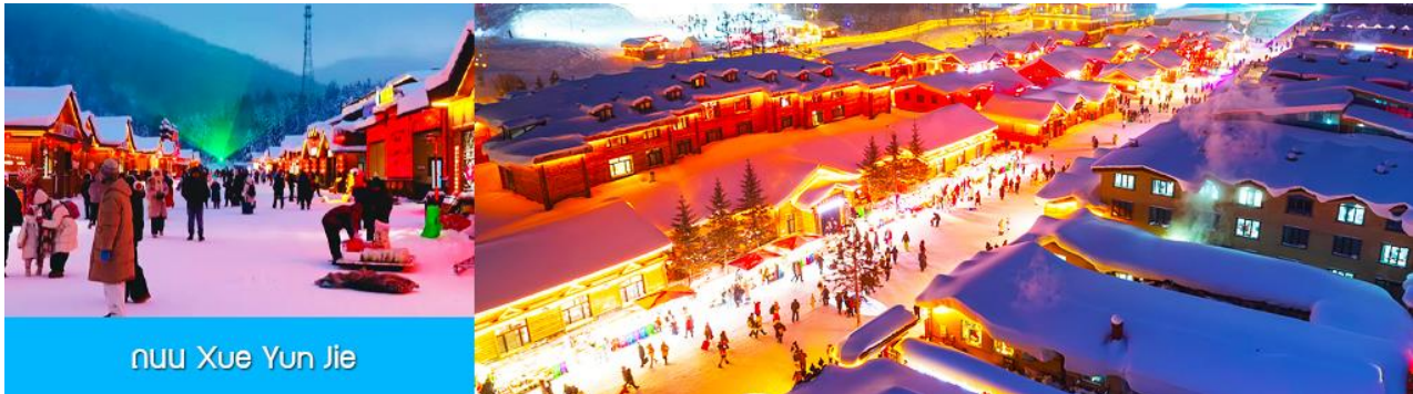
ถนน Xue Yun Jie

รับประทานอาหารค่ำ ณ ร้านอาหารพื้นเมืองในเมืองหิมะ (6)