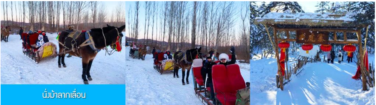
นั่งม้าลากเลื่อน