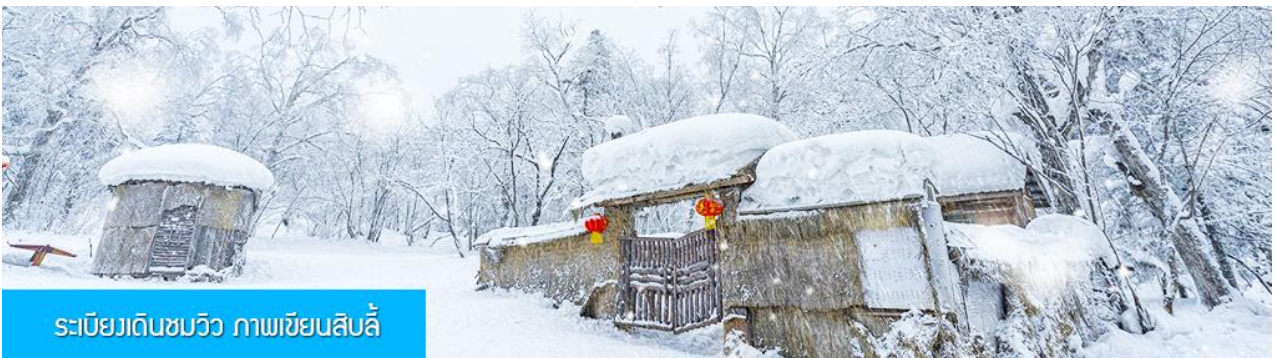
ระเบียบเดินชมวิว ภาพเขียนสิบลี้