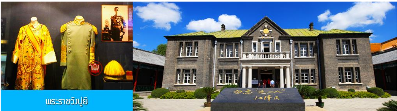
พระราชวังปู้ยี้

รับประทานอาหารเช้า ณ ห้องอาหารของโรงแรม (7)