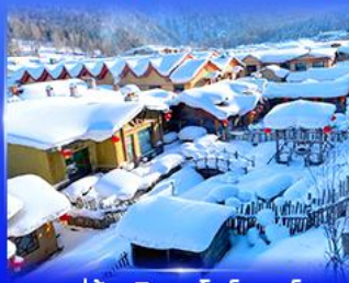
หมู่บ้านหิมะ สโนว์ทาวน์