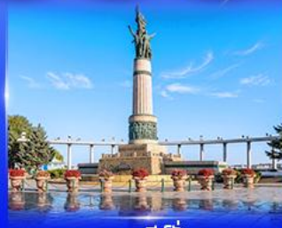
อนุสาวรีย์ฝังหิม