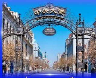
ย่านจงหยาง สตรีท