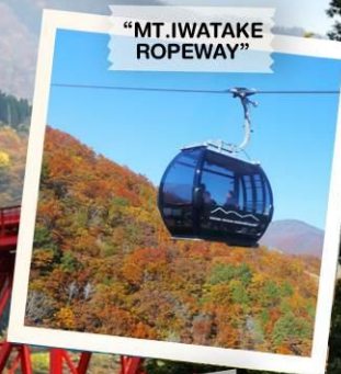
“MT. IWATAKE ROPEWAY”