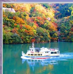
“SHOGAWA YURAN CRUISE”