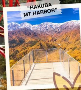
“HAKUBA MT. HARBOR”