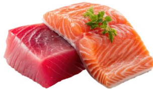
● เนื้อปลาดิบ