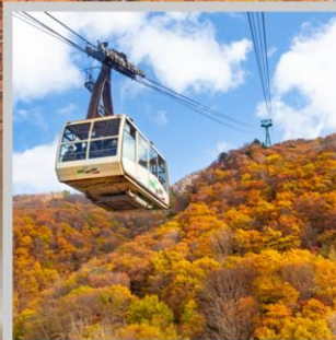
“ZAO CHUO ROPEWAY”