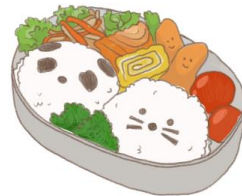
● อาหารสำหรับเด็ก ( 2-11 ปี ) *วัตถุประสงค์ขึ้นอยู่กับทางร้าน