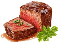
● เนื้อวัว

ขอความกรุณาแจ้งวัตถุประสงค์ที่ท่าน แพ้หรือไม่สามารถรับประทานได้