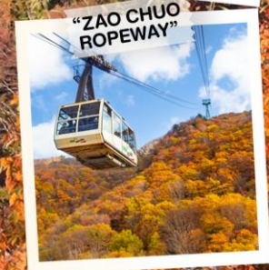
“ZAO CHUO ROPEWAY”

วันเดินทาง 30 ต.ค. - 5 พ.ย. 2569 4 - 10 พ.ย. 2569