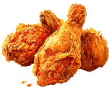
● เนื้อสัตว์ปีก (ไก่)