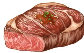
● เนื้อหมู