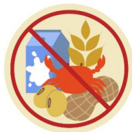
● แพ้อาหาร / อื่นๆโปรดระบุ