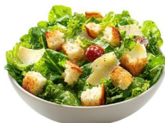
● ล้างวิธี