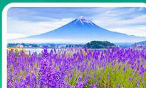
สวนโออิชิพาร์ค