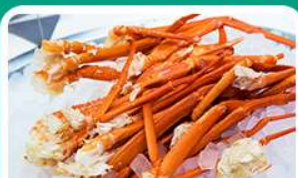
พิเศษ! บุฟเฟ่ต์ขาปู