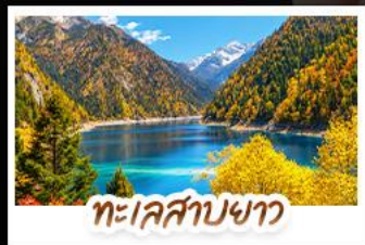
ทะเลสาบขาว