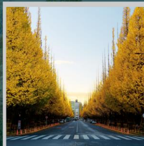
“ICHONAMIKI GINGO AVENUE”