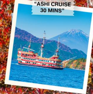
“ASHI CRUISE 30 MINS”