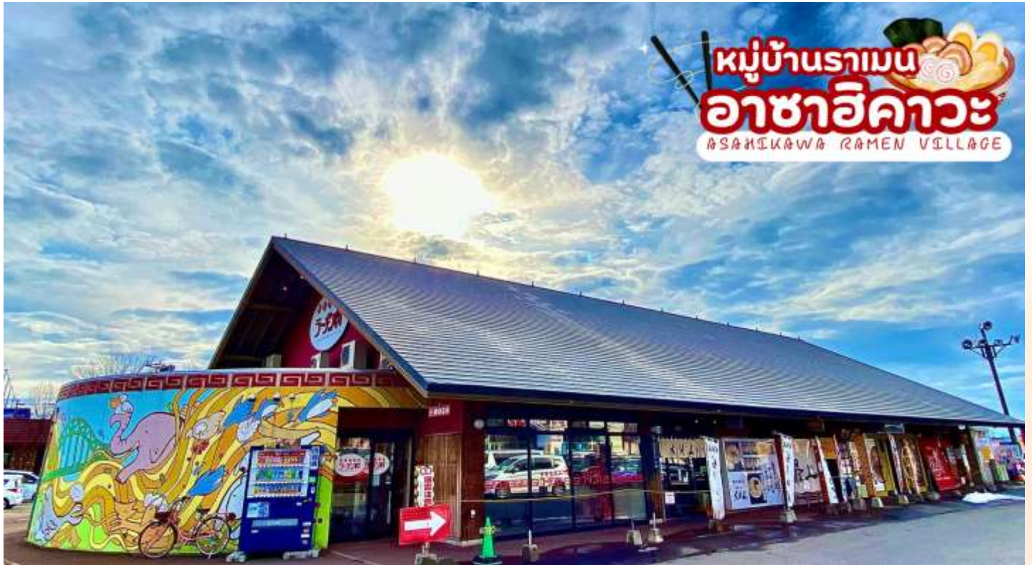
ร้านราเมน ที่แนะนำ

นำท่านเดินทางสู่ ราเมนต้นตำรับแท้สไตล์ฮอกไกโดที่ หมู่บ้านราเมนอาซาฮิคาวะ (Asahikawa Ramen Village) ราเมนของที่นี่มีรสชาติอันเป็นเอกลักษณ์และได้รับการกล่าวขานถึงความอร่อยมายาวนานกว่าทศวรรษ หมู่บ้านราเมนอาซาฮิคาว่าได้ถือกำเนิดขึ้นในปี 1996 โดยรวบรวมร้านราเมนชื่อดังของเมืองอาซาฮิคาว่าทั้ง 8 ร้าน มาอยู่รวมกันเป็นอาคารหลังคาเดียว เสมือนหมู่บ้านราเมนที่รวบรวมร้านดังขึ้นเทพไวโนทีเดียว ในประเทศญี่ปุ่นจะแบ่งประเภทราเมนตามสูตรทั้งหมด 4 สูตร ได้แก่ ชิโอะราเมน (ราเมนผสมเกลือในน้ำซุป์) โชยุราเมน (ราเมนผสมซีอิ๊วญี่ปุ่น) มิโอะราเมน ต้นกำเนิดมาจากฮอกไกโด (ผสมเต้าเจี้ยวญี่ปุ่นในน้ำซุป์) ทงคัตซึราเมน (ราเมนกระดูกหมูสีขาวครีม) นอกจากนี้ยังแบ่งตามสูตรของแต่ละท้องถิ่น