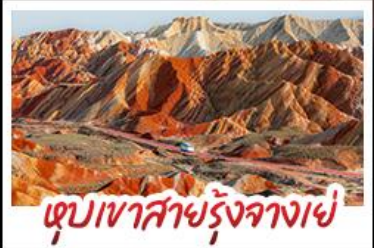
หุบเขาสายรุ้งจางเย่