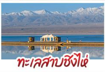
ทะเลสาบซิงไห่