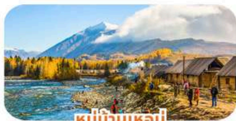
หมู่บ้านเหม่จู