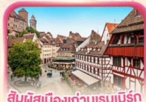
สัมผัสเมืองเก่าบูร์ก