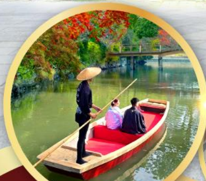
กิจกรรมล่องเรือยามากาวะ