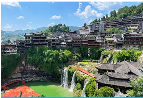
เมืองโบราณ ฝูหรงเจิ้น