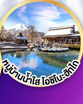
หมู่บ้านน้ำใส ไอชิโนะ-ซึกโก