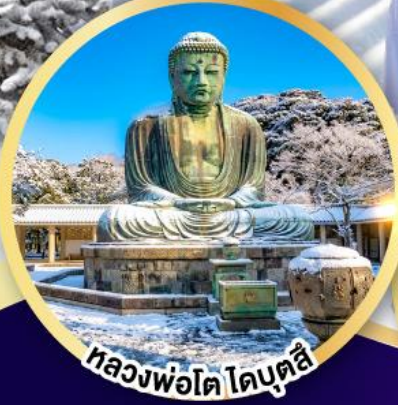
หลวงพ่อโต โดมุตสึ