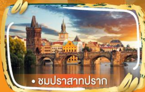
• ชมปราสาทปราก