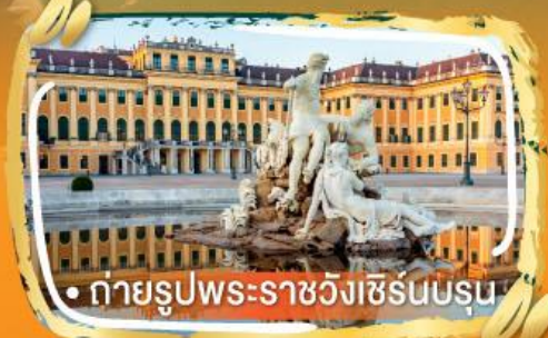
• ถ่ายรูปพระราชวังเซรินบรุน