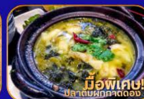
มีอพิเศ! ปลาต้มผักกาดดอง