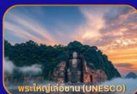
พระใหญ่เล่อซาน (UNESCO)

ล่องเรือชม “พระใหญ่เล่อซาน” - เมืองโบราณหวงหลงซี - แพนด้าเซลฟี - ห้างสรรพสินค้า - Wangjianglou Park - ถนนชุนซีลู่ (แหล่งช้อปปิ้ง) - IFS (แพนด้าปีนตึก) - วัดต้าเจี้อ