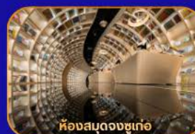
ห้วงสนมดงซูเก้อ