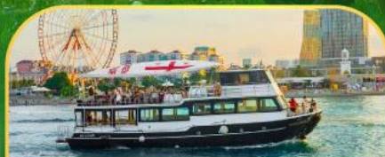
ล่องเรือทะเลดำ