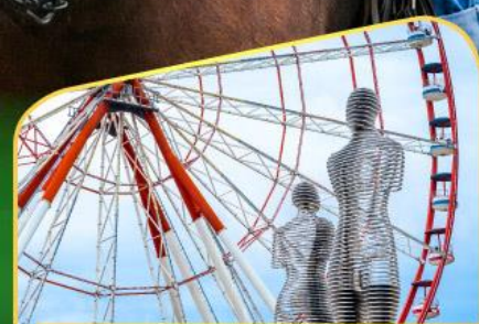
อนุสาวรีย์อาลีและนีโน่