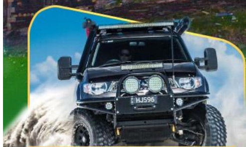
คันรถ 4WD สู้อีกกลางเทือกเขาคอเคซัส