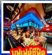
บุฟเฟต์ซีฟู้ด