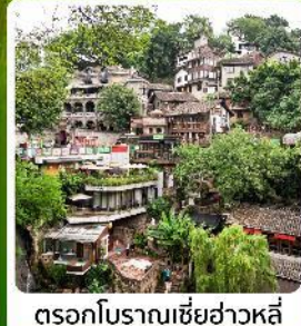
ตรอกโบราณเขี้ยวฮั่วหลี่