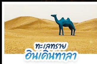
ทะเลทราย อินเคินทาลา