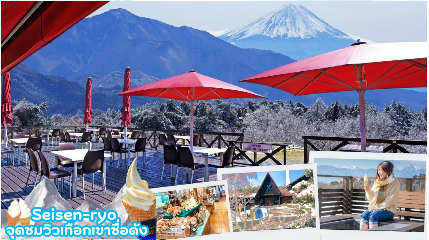
Seisen-ryo จุดชมวิวเทือกเขาชื่อดัง

เมืองโฮคุโตะ (Hokuto) ตั้งอยู่ทางตะวันตกเฉียงเหนือของจังหวัดยามานาชิ เป็นเมืองที่ล้อมรอบไปด้วยภูเขาสูง เช่น ภูเขาýtตสึงาตาเกะ เทือกเขาแอลป์ตอนใต้ ภูเขาคินปู และภูเขาคายะงาตาเกะนอกจากนั้น ยังสามารถเห็นวิวที่สวยงามของภูเขาไฟฟูจิได้อีกด้วยมีทรัพยากรธรรมชาติที่มีคุณภาพ ไม่ว่าจะเป็น น้ำแร่ เมล็ดข้าว และผลิตภัณฑ์จากนมวัว