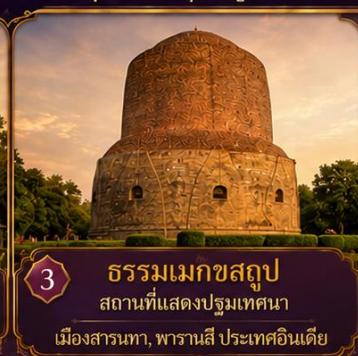
3 ธรรมเมกขสถูป สถานที่แสดงปฐมเทศนา เมืองสาธนา, พาราณสี ประเทศอินเดีย