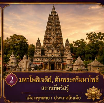
2 มหาโพธิเจดีย์, ต้นพระศรีมหาโพธิ์ สถานที่ตรัสรู้ เมืองพุทธคยา ประเทศอินเดีย