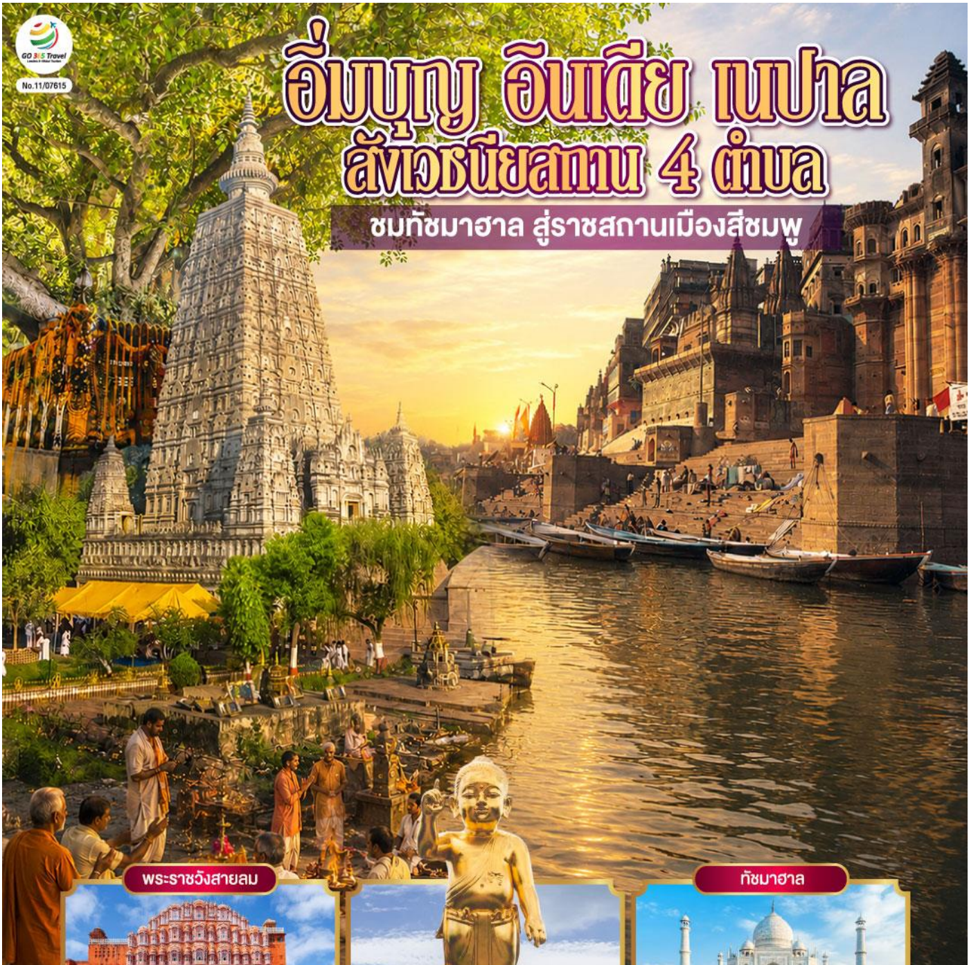
พระราชวังสายลม