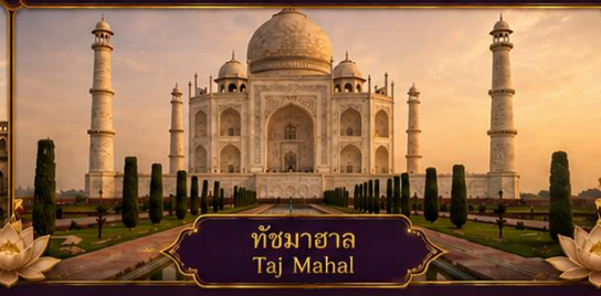
ทัชมาฮาล Taj Mahal