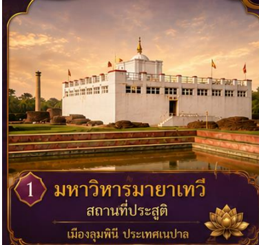
1 มหาวิหารมายาเทวี สถานที่ประสูติ เมืองลุมพินี ประเทศเนปาล