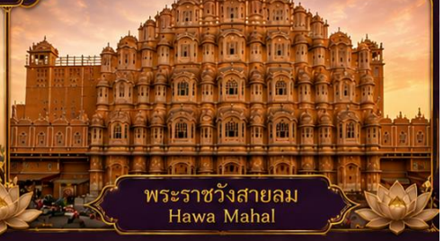
พระราชวังสายลม Hawa Mahal