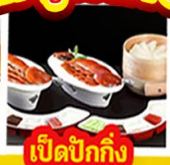
เปิดปีกกึ่ง