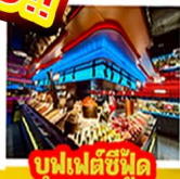
บุฟเฟต์ซี่ฟู้ด