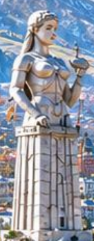
MOTHER OF GEORGIA อนุสาวรีย์มารดาแห่งจอร์เจีย