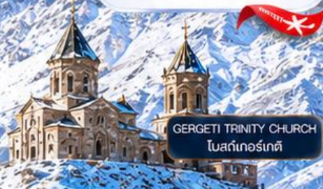
GERGETI TRINITY CHURCH โบสถ์เทอริเทตี