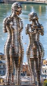
ALI & NINO ประติมากรรมแห่งความรัก