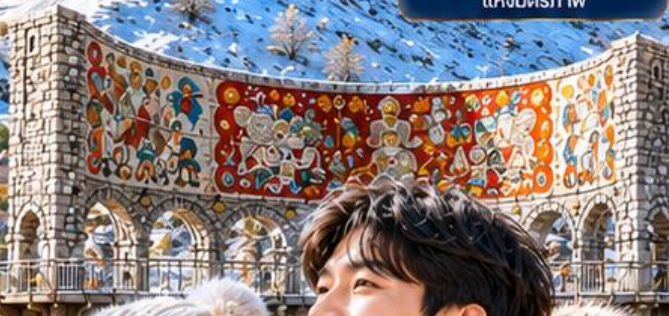
RUSSIA GEORGIA FRIENDSHIP MONUMENT อนุสรณ์สถานรัสเซีย-จอร์เจีย แห่งมิตรภาพ