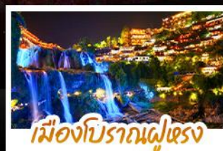
เมืองโบราณฝูเจียง