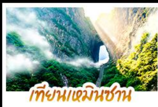
เทียนเหมินชาน

การันตีเที่ยวเต็มอิ่มแบบไม่ลงร้าน • รวม 5 เมืองโบราณชื่อดังไว้ในทริปเดียว ขึ้นเขาหวดด้วยลิฟท์แก้วไปหลง • นั่งกระเช้าพิชิตท้ำประตูสวรรค์เทียมหมินซา เดินท้าความเสียวบนหน้าผากระจก • ล่องเรือชมภาพเขียนแม่น้ำอู๋เจียง