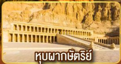
หุบผากษัตริย์