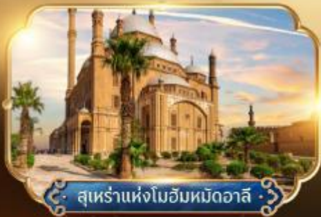
สุเหร่าแห่งโมฮัมหมัดอาลี