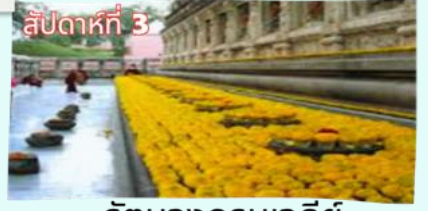
สัปดาห์ที่ 3 รัตนงกรมเจดีย์