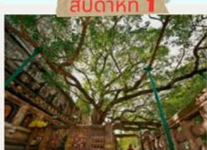
สัปดาห์ที่ 1 ต้นพระศรีมหาโพธิ์