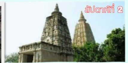
สัปดาห์ที่ 2 อนิมิสเจดีย์