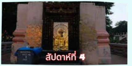
สัปดาห์ที่ 4 รัตนขรเจดีย์ (ซุ้มเรือนแก้ว)

เรียบร้อยแล้ว นำคณะจาริกบุญสวดมนต์ทำวัตรเย็น บูชาพระรัตนตรัย และสวดมนต์บูชาสังเวชนียสถาน จากนั้นเชิญท่านทำศนาธรรม นั่งสมาธิปฏิบัติบูชาตามอธยาศัย สมควรแก่เวลา นัดหมายเวลาเชิญท่านกลับโรงแรมที่พัก