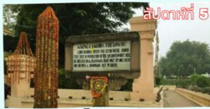
สัปดาห์ที่ 5 อชปาโลนคร (จำลอง)

เดินทางถึงบริเวณองค์พระมหาเจดีย์พุทธคยา ผ่านด่านตรวจรักษาความปลอดภัยเรียบร้อย แล้วนำคณะกรรabanมัสการพระพุทธรเมตตาซึ่งประดิษฐานภายในพระมหาเจดีย์ และกราบสักการะต้นพระศรีมหาโพธิ์ จากนั้นนำชมสัตตมหาสถาน ธรรมสถานแห่งพระพุทธเจ้าเสวยวิมุตติสุขหลังจากตรัสรู้ 49 วัน ทั้ง 7 แห่ง โดยรอบ อันประกอบไปด้วยสถานที่จริงสัปดาห์ที่ 1 - 4 และสถานที่จำลองในสัปดาห์ที่ 5 - 6