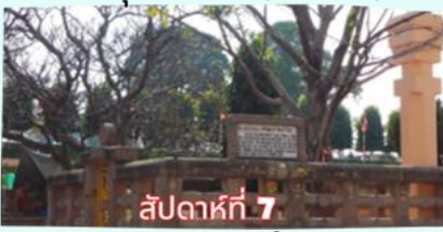
สัปดาห์ที่ 7 ราชายตนะ (จำลอง)