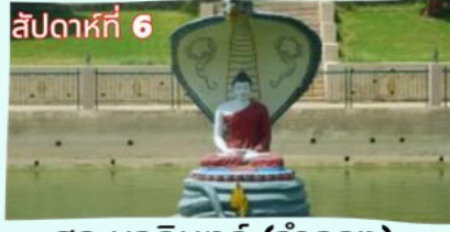
สัปดาห์ที่ 6 สระมูจลินทร์ (จำลอง)