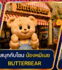
สนุกกับโซน น่องหมีเนย BUTTERBEAR