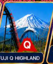
FUJI Q HIGHLAND