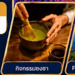
กิจกรรมชงชา