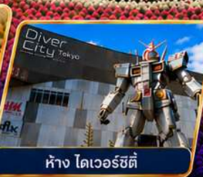
ห้าง ไดเวอร์ซิตี