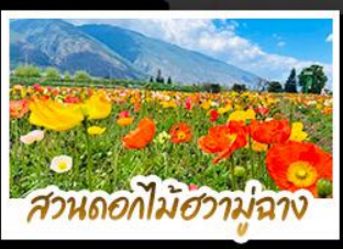
สวนดอกไม้ฮวามู่ฉาง