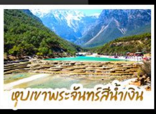
เขุบเขาพระจันทร์สีน้ำเงิน