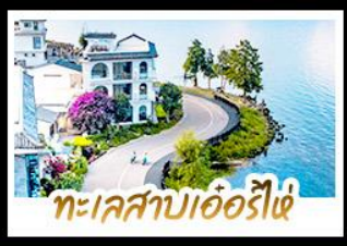
ทะเลสาบเอ๋อร์ไห่