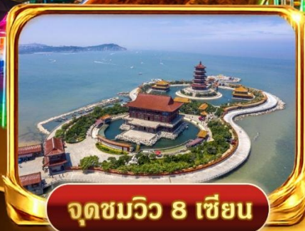
จุดชมวิวกว 8 เซียน