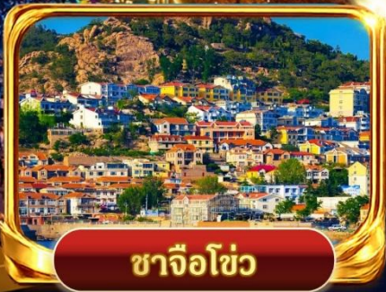
ซาจิวโซ่ว