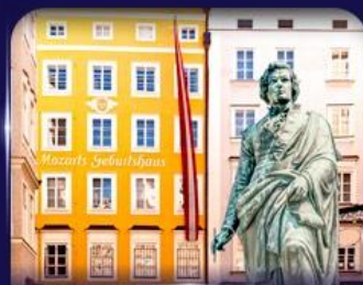
บ้านเกิดโมสาร์ท ซาลซ์บูร์ก