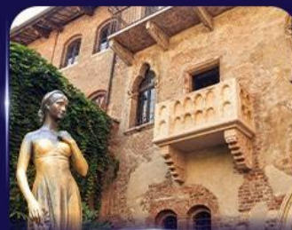
เขื่อนบ้านลูเลียน เวโรนา