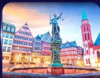
จัตุรัสโรเมอร์ แพรงก์เฟิร์ต