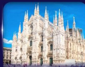
เซนต์มาร์กาเรท มิลาโน