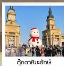
ตุ๊กตาคิมะยักซ์