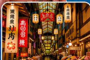
ตลาดปลานิชิกิ เกียวโต