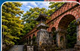
วัดนินเซ็นจิ เกียวโต