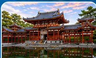
วัดเบียวโดอิน เมืองอุจิ