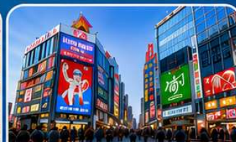
ช้อปปิ้งย่านชินไซบาชิ โอซาก้า