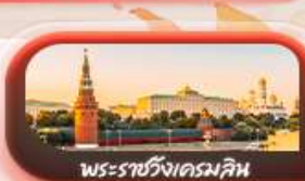
พระราชวังเครมลิน