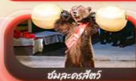
ขั้มละครีตซ์

09-16 ต.ค.69 / 15-22 ต.ค.69 / 22-29 ต.ค.69