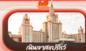
เทินเวาสเปิร์ม