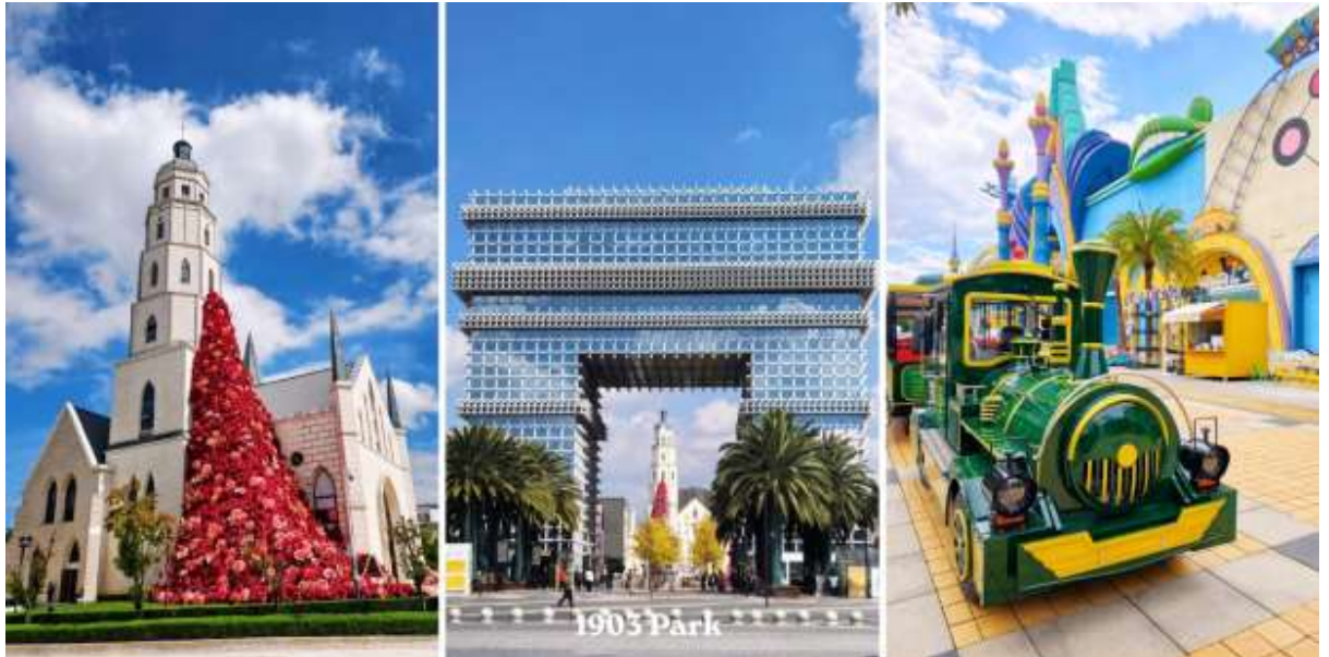
วัดหยวนทง – PARK1903 – สนามบินคุณหมิงฉางชู่ – กรุงเทพฯสุวรรณภูมิ (อิสระอาหารกลางวัน)

จากนั้นนำท่านสู่ Park 1903 (สวน 1903) แลนด์มาร์คสุดชิค ได้กลิ่นอายยุโรปและศูนย์การค้าไลฟ์สไตล์ใจกลางเมืองคุณหมิง (มณฑลยูนนาน) ที่โดดเด่นด้วยการจำลองสถาปัตยกรรมสไตล์ยุโรป ผสมผสานศิลปะ ความบันเทิง และสวนสนุกเข้าไว้ด้วยกันอย่างลงตัว สถาปัตยกรรมจำลอง ประตูชัยปารีส อันโด่งดังโบสถ์คริสต์ (Gospel Auditorium) และพื้นที่จัดแสดงนิทรรศการPop Mart สาขาใหญ่ สำหรับสายอาร์ตทอยสวนสนุก Dream Park: สวนสนุกที่มีทั้งโซนในร่มและกลางแจ้ง (ตั๋วไม่รวมค่าเข้าสวนสนุก)เป็นแหล่งเสื้อผ้าแบรนด์เนมทั้งของจีนและต่างประเทศ เครื่องประดับอัญมณีชิ้นเยี่ยม ร้านเครื่องดื่ม ร้านอาหารพื้นเมือง