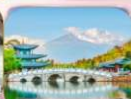
สะพานมิ่งงา