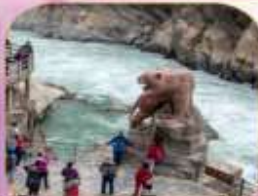
ช่องแคบเลือกระโจน