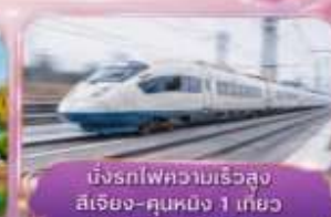
นั่งรถไฟความเร็วสูง สี่เฉียง-คุนหมิง 1 เที่ยว (รวมรถขงกระบี่)