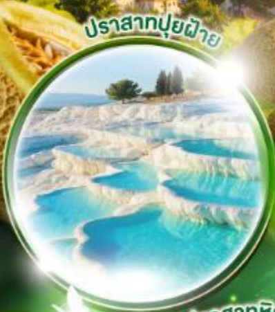
ปราสาทหินยิวซาร์