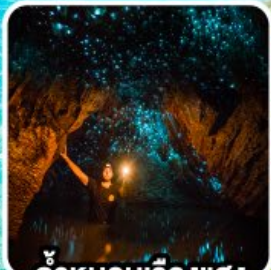
ถ้ำทอนเรืองแสง ไวโตโม