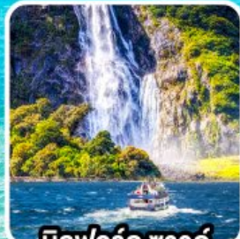
บิลฟอร์ด ซาวด์ นั่งเรือชมความงาม ฟยอร์ด