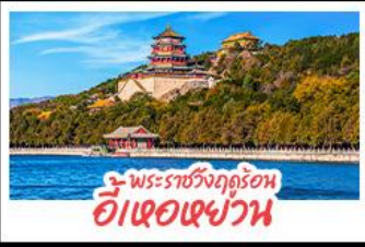
พระราชวังฤดูร้อน อ่าวเซ่หยวน