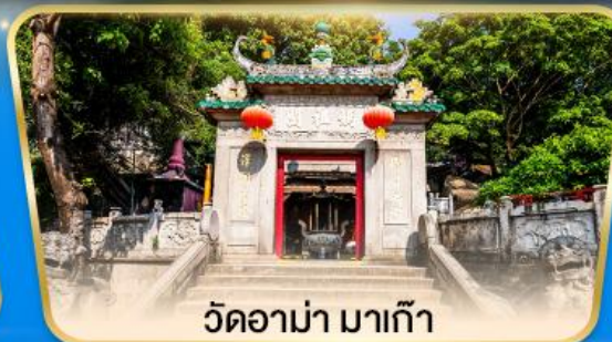
วัดอามา มาเก๊า