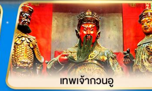
เทพเจ้ากวนอู